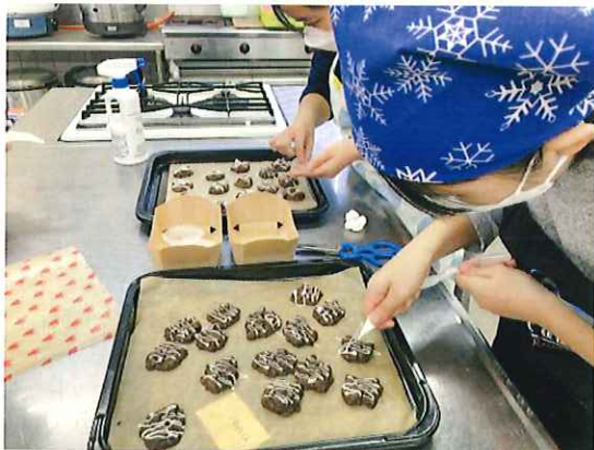
いい感じに焼き上がりました