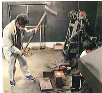
焼いた鉄を打つ「鍛錬」という作業