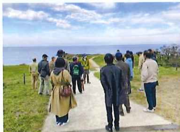
「こんなところ来たことない」 丹後町大成古墳群