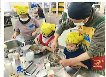
みんなで楽しく作ります