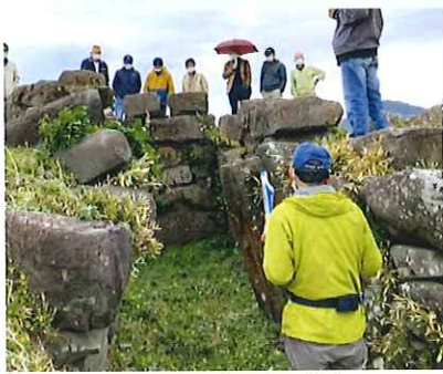
横穴式古墳の大きさに驚き！ 丹後町大成古墳群