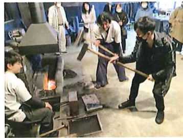
日本刀作りを体験 丹後町の日本刀工房「玄承社」