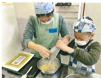
いっしょに混ぜます