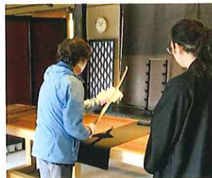
「真剣」をじっくりと見る